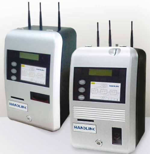
KS-861 Banknote Model